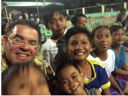
Voor de crusade maakte in al veel vriendjes