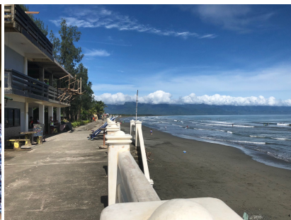
Bezoekje aan Baler Bay aan de oostkust