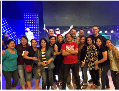
In de kerk van Cavite met oude bekenden