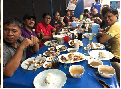
Na afloop samen eten hoort erbij. Masarap!