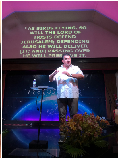
Prediken in de kerk van Zaldy in Paniqui