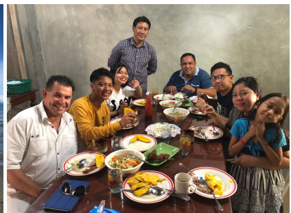
Samen eten hoort erbij in deze cultuur

Nu als serie te zien op Family7 Een serie van 13 afleveringen