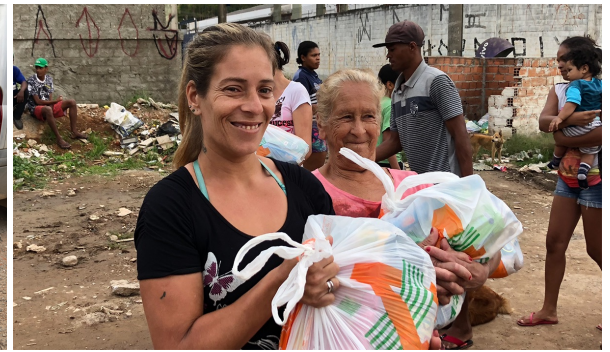
Voedselpakketten uitdelen in favela San Rafael - kinderen knuffelen en dan zien we van die heel dankbare gezichten, prachtig!