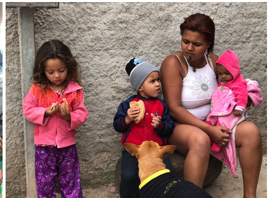
De krottenwijken zijn ronduit afschuwelijk, maar de mensen die er wonen zijn prachtige parels die we uit het slijk mogen halen.

Ik had nog wel 100 andere foto's willen laten zien en een boek vol verhalen willen schrijven. Want dit korte verslag doet geen recht aan alle prachtige dingen die we samen hebben beleefd. Een levensveranderende ervaring voor de meesten. En zeker voor herhaling vatbaar. In de toekomst hoop ik dan ook vaker naar Brazilië te gaan om de blijde boodschap van onze Heer te brengen.