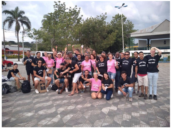
Met bijna 30 man hadden we een schitterend team uit NL