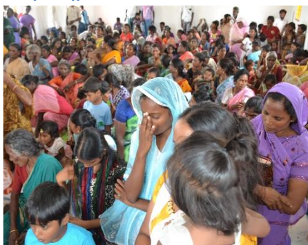
De eerste kerk gelijk stampvol mensen