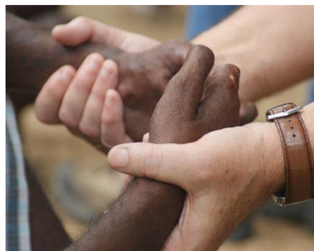
Bidden voor de melaatsen