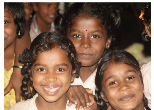
Kinderen in ons kinderkuis in Chennai