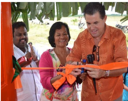
Opening van de 1e kerk "Fathershouse"