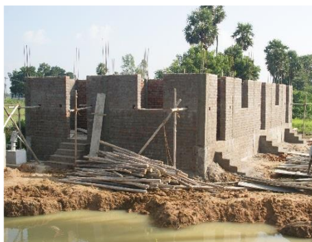
De bouw van het derde kerkje