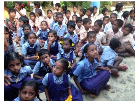
Bezoek aan onze schoolkinderen

Dit korte verslag geeft slechts een deel weer van alles wat we in die twee weken beleefd hebben, maar het geeft in ieder geval een indruk van ons dankbare werk in India. Er zijn nu 11 kerkjes gedoneerd. Het komende jaar zullen ze gebouwd en in gebruik genomen worden als kerkje, schooltje, ontmoetingsplaats en als medische hulppost waarbij er tevens een schoondrinkwater voorziening wordt geplaatst. Er is gewoon te veel om in dit korte bericht te delen, kijk daarom op www.abbachildcare.org voor meer verhalen en foto's. Het was in alle opzichten een heel gezegende reis. Ik hoop gauw weer terug te gaan (in januari 2015).