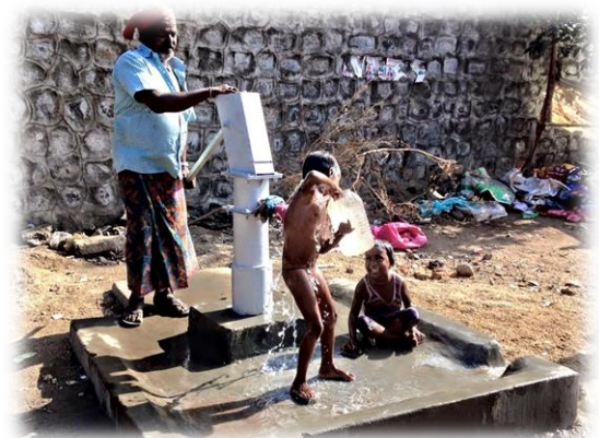
...vrijdag was er schoon en veilig drinkwater