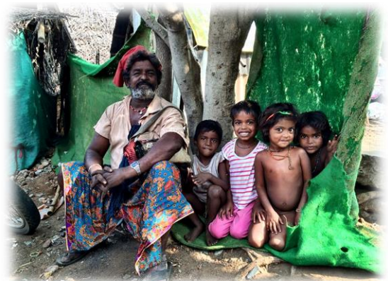
Een blij zigeunerfamilie vanwege de nieuwe put.