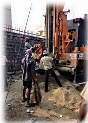
woensdag opgebouwd en...