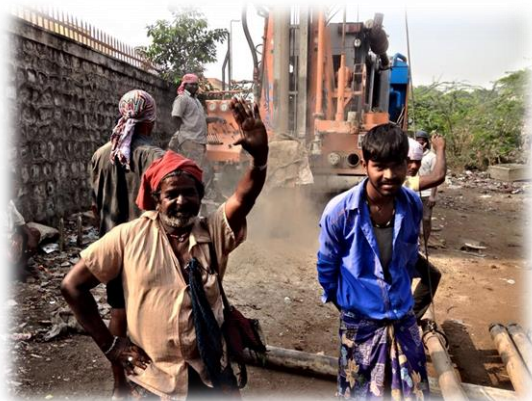
Maandag besloten, dinsdag begonnen...