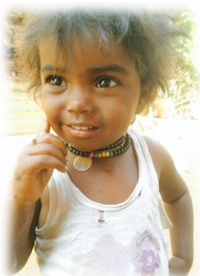
Een prachtig zigeunerjochie.