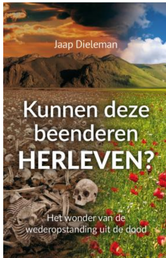
Kunnen deze beenderen herleven?

Een profetische boek over eindtijd, Israël en Gods plan voor deze wereld, met een sterk licht op wat er nu in de wereld gebeurt en in het bijzonder met Israël dat Gods klok is voor deze tijd.