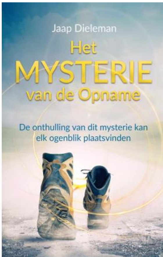
Het mysterie van de Opname

Dit is het nieuwste boek van Jaap over het mysterie van de gemeente die in een ondeelbaar ogenblik zal worden weggenomen. Laat je inspireren door deze hoopgevende boodschap.